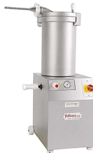
E 25 / E 42